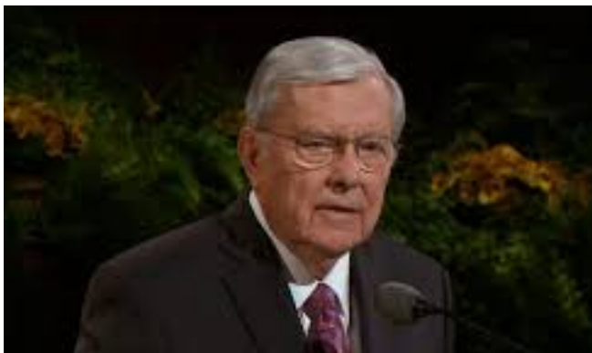
M. Russell Ballard