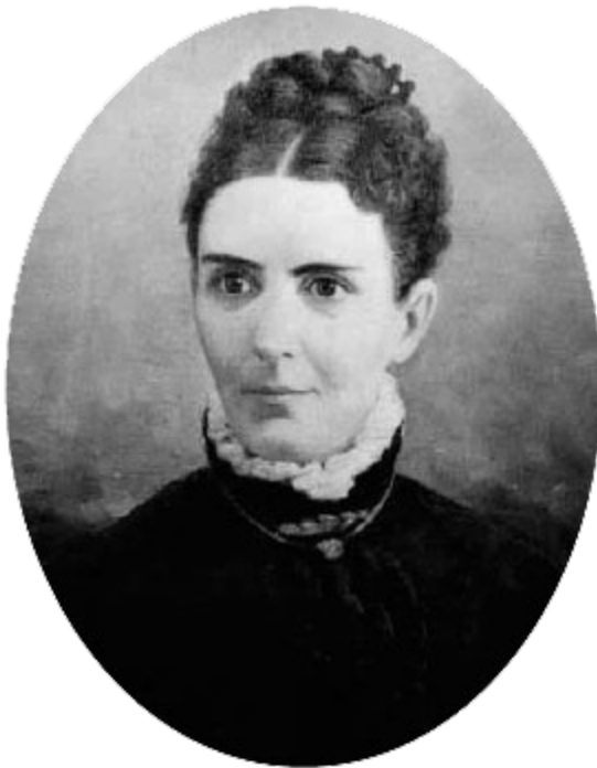
Ellis Shipp, una de las primeras doctoras en el territorio de Utah

De hecho, los hombres y las mujeres a menudo se casaban a una edad mucho más joven en el siglo 19 de lo que se considera aceptable hoy. El historiador Kathryn Daynes, que ha estudiado el tema en profundidad, dice que, aunque el promedio de edad de las mujeres que entraban en la institución del matrimonio en los Estados Unidos durante el siglo XIX era veinte años o más, no era extraño que una niña se casara a los 15 años y ciertamente no era considerado abuso. La edad para contraer matrimonio de derecho común para las mujeres era 12 años. Históricamente, en las afueras del noroeste de Europa, las mujeres de 14 a 16 se consideraban listas para el matrimonio.