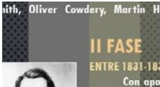
Gráfico / Historia

Las fases de transformación de José Smith Primero, él fue un visionario. Luego, fue un doctrinario, y finalmente un organizador político. ¿Quiénes fueron sus influencias? ¡La respuesta está en este infográfico!